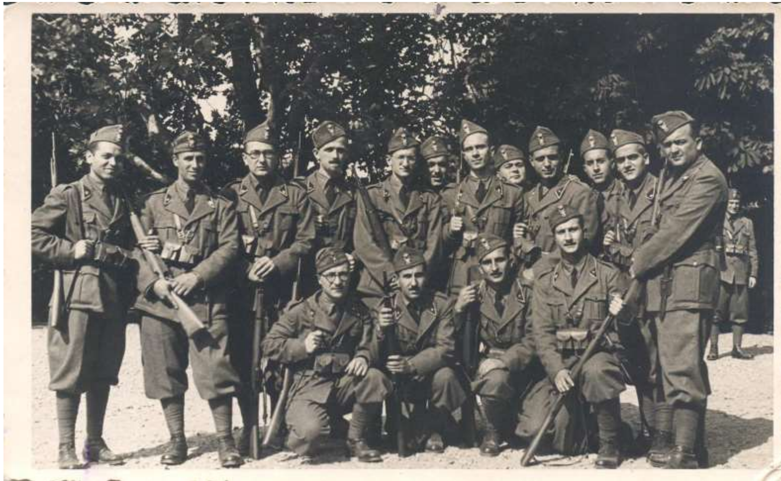
Una foto di gruppo